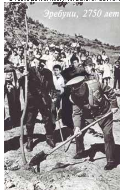
Эребуни, 2750 лет